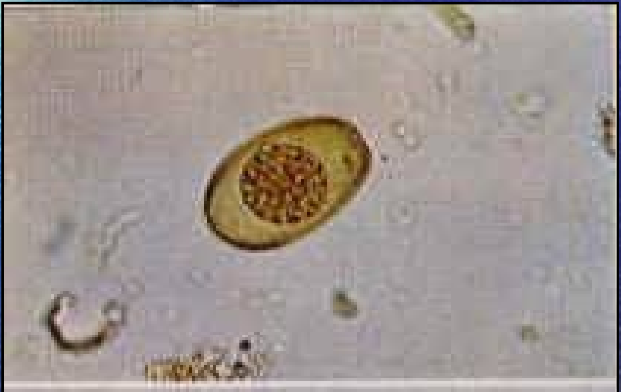
OOQUISTES E. STIEDAI